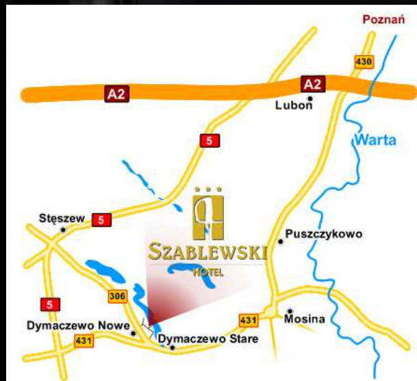
ul. Pod Topolami 1, Dymaczewo Nowe (GPS :N 52° 13' 49", E 16° 45' 51")

Organizatorzy zachęcają do spotkania się w sobotę 11.05.2013r o godzinie 11.00 w restauracji Dom nad Rzeką w Skwierzynie, gdzie zostanie podany obiad, a następnie do wzięcia udziału we wspólnym wyjeździe szlakiem mostów zwodzonych w Międzyrzeckim Rejonie Umocnionym (MRU). Organizatorzy zaznaczają, że wyjazd nie jest częścią spotkania i organizatorzy nie ponoszą odpowiedzialności za uczestników. Wyjazd z parkingu restauracji o godzinie 12.00.